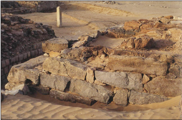
اللوحة ٣: عمارة المنشآت التجارية في سوق شمر (السلسلة الجنوبية)، مع توضيح الأزقة (الممرات) بين الدكاكين. نقلاً عن (عريش، منير؛ فونتتين، أوج، ٢٠٠٥م: ٦٤).

وقد كان لسوق المدينة دور أساسي في إنشاء المَدن، إذ تُعد السوق من أهم العوامل المساعدة التي أدت إلى تطور المَدن، وكان يتم اختيار الموقع الذي يسهل الوصول إليه ويقع على ساحة واسعة، حتى يتم فيها تبادل السلع التجارية؛ وكانت مدينة تمنع من أهم تلك المَدن التي توافرت فيها هذه الخاصية لإقامة السوق التجاري المعروفة بسوق شمر (حنشور، ٢٠٠٧م: ٥٧).