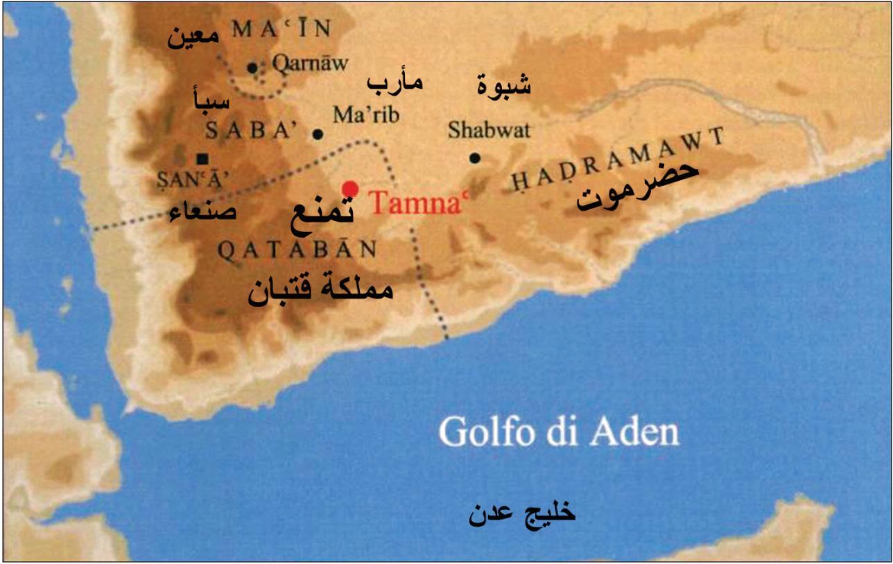
الخريطة ٣: موقع مملكة قتبان وعاصمتها تمنع، مع توضيح مواقع الممالك العربية القديمة المجاورة لها مثل (سبأ- معين حضرموت) نقلاً عن (دي مجريت، رويان، ٢٠٠٦م: ٢) ترجمة الباحث.

الاستواء، يحدها من الشرق مملكة حضرموت، ومن الشمال ما يعرف بصحراء رملة السبعين وهي جزء من صحراء الربع الخالي، ومن الجنوب الشرقي أراضي مملكة أوسان، التي سُرعان ما انضمت تحت راية مملكة قتبان، وإلى الغرب أراضي مملكة حمير (الحاج، ٢٠١٥م: ٢٦)، وإلى الغرب من وادي بيحان يقع وادي (حريب) الذي يقع تحت سيطرة أراضي مملكة قتبان وعاصمتها تمنع وهو ثاني أهم أودية مملكة قتبان (عبدالله، ١٩٧٩م: ٥)، كما جاء وصف وادي حريب لدى الهمداني في كتابه (صفة جزيرة العرب) مقترناً مع وادي بيحان بل جاء في الوصف قبل وادي بيحان (الهمداني، ٢٠٠٨م: ٢٠٤). وهو ما يدل على أن الهمداني قد وصف المنطقة من الغرب باتجاه الشرق (خريطة: ٢).