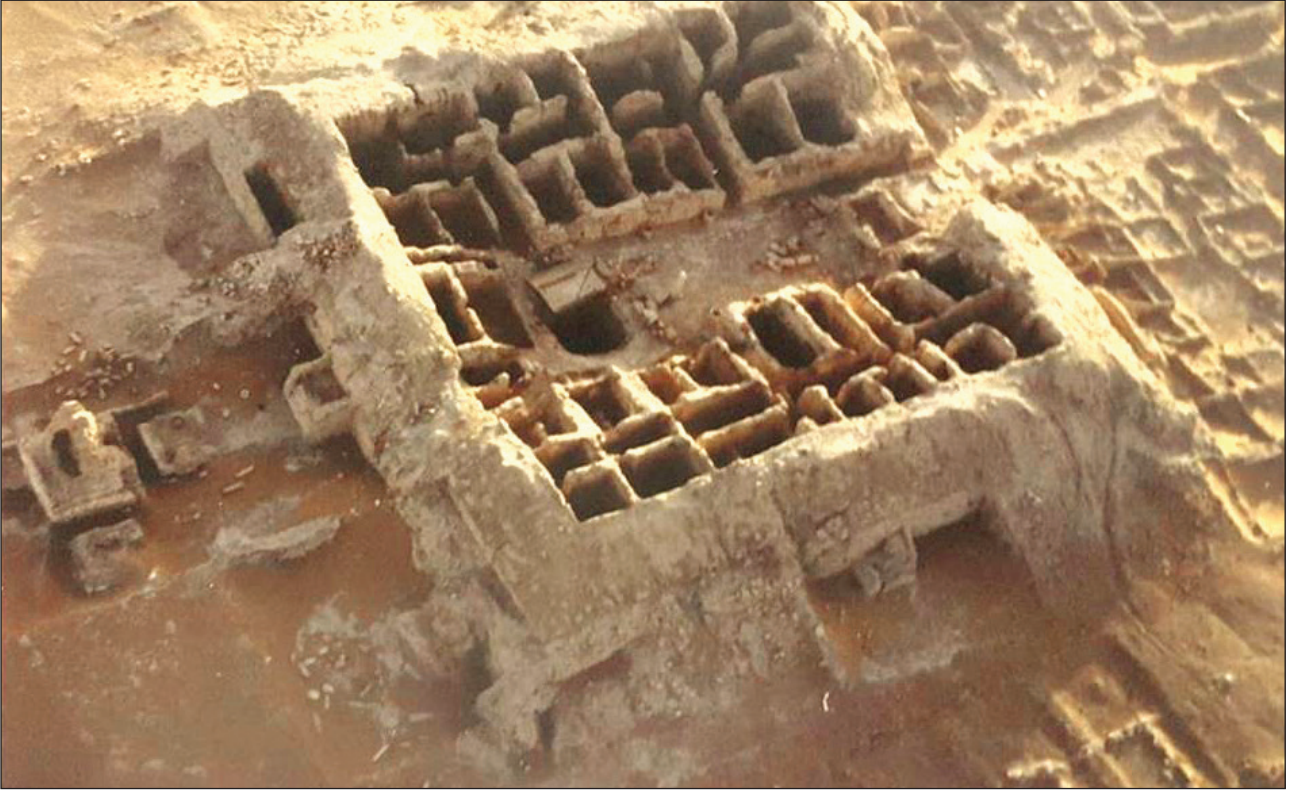
اللوحة: ٦ سوق قرية الفاو مع توضيح مواقع الأبراج التي تعطي السوق، وتخطيطه الداخلي من محلات تجارية وأزقة (ممرات)، نقلًا عن (طيران، وآخرون، ٢٠١٧م: ٢٨).

في دراسة مقارنة مكتملة لسوقين شهيرين من أسواق العرب قبل الإسلام، وهما سوق شمر في مدينة تمنع في جنوبي الجزيرة العربية وسوق قرية الفاو (ذات كهل) في وسط الجزيرة العربية ولما تحمله معاني التشابه بينهما، فقد كانا نماذج مكتملة لبعضهما بعضاً، لتوضيح الصورة عن تلك المهنة، وقد تناول الباحث هذه الدراسة كدراسة مقارنة تخطيطية معمارية بينهما.