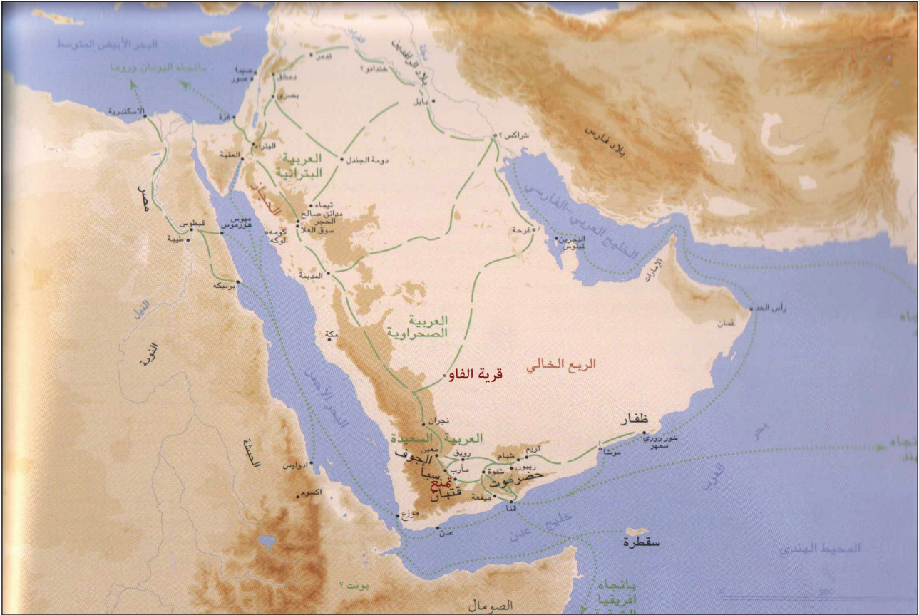
الخريطة ٢: موقع مدينة تمنع، وقرية الفاو، مع توضيح طرق التجارة العالمية القديمة، وموقع مدينة تمنع، نقلاً عن (عريش، منير؛ فونتين، أوج، ٢٠٠٥م: ١٣).

قوة المملكة المسيطرة في تلك الفترة، إذ يعتمد الباحثون في تحديد أراضي كل مملكة من خلال مواقع العثور على النقوش التي تعود لأي مملكة، إذ نجد أن الكتابات التي تعود للغة القتبانية، من المعروف أن مواقعها كانت تحت سيطرة مملكة قتبان، بالإضافة للتعرف على تحديد أراضي مملكة قتبان من خلال معرفة الديانة التي كان يعبدها المجتمع القتباني، إذ تمتد قتبان من الشمال الغربي حتى مدينة دمار، وتمتد إلى الجنوب حتى مدينة عدن، وهو ما ذكرته المصادر الكلاسيكية التي أفادت بسيطرة القتبانيين على مضيق باب المنذب وعاصمتهم مدينة تمنع (دي مجريت، رويان، ٢٠٠٦م: ٧) (خريطة: ١-٢).