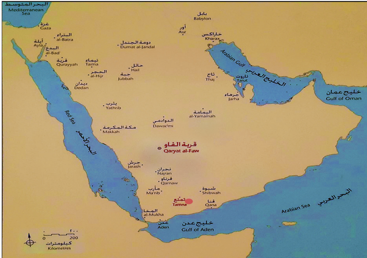
الخريطة ١: موقع مدينة تمنع عاصمة مملكة قتيبان، وموقع قرية الفاو في الجزيرة العربية.

توافرت في مناطق إقامة الأسواق عدد من الأمور المهمة، منها ما يتعلق بالجانب المعماري وهو سكن للتجار،