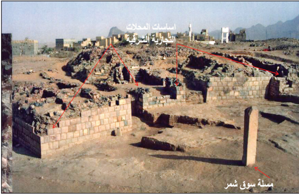
اللوحة ٢: أساسات المحلات التجارية الجنوبية من سوق شمر، وبالوسط مسلة سوق شمر تتوسط الساحة، نقلاً عن (دي مجريت، روبان، ٢٠٠٦م: ٩).