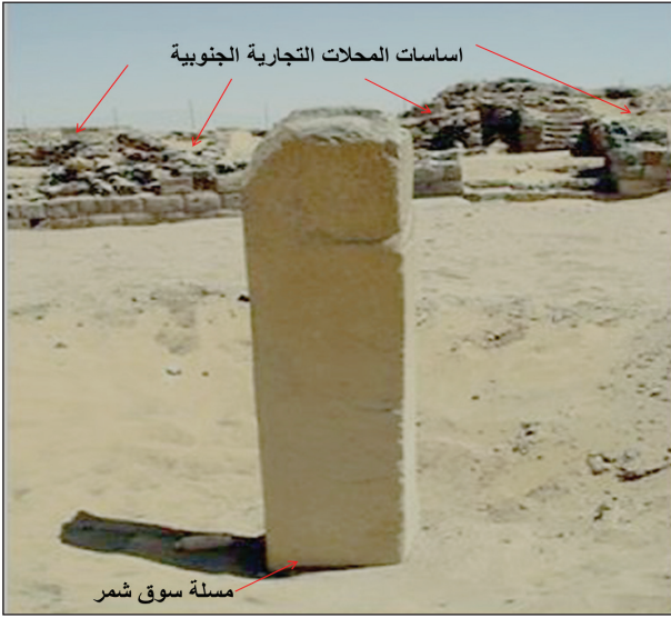
اللوحة ١: مسلة قانون سوق شمر التجاري، مع توضيح أساسات المنشآت التجارية الجنوبية وتظهر بالوسط ساحة السوق. نقلاً عن (عبدالله، ٢٠٠٦م: صورة ١٠).